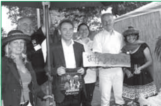
Station Latein-Amerika am Stand des Vereins „Hilfe für Ayacucho“ mit dem französischen Bürgermeister von Großblittersdorf (Mitte).

Mehr Infos unter: www.faires-saarbruecken.de