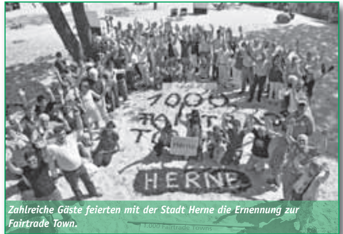
Zahlreiche Gäste feierten mit der Stadt Herne die Ernennung zur Fairtrade Town.

sche Stadt. In Herne wird die Kampagne Fairtrade Town durch eine Steuerungsgruppe vorangetrieben. Zu dieser Gruppe gehören unter anderem das Eine-Welt-Zentrum und die Stadtverwaltung. Ziel der Kampagne Fairtrade Towns ist, den Absatz von Fairtrade gesiegelten Produkten zu steigern und ein Bewusstsein für nachhaltigen Konsum sowohl in der Bevölkerung als auch in Verwaltung, Politik und Kirche zu schaffen.