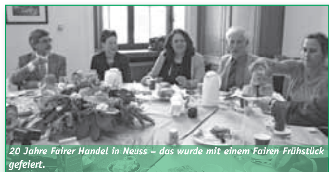
20 Jahre Fairer Handel in Neuss – das wurde mit einem Fairen Frühstück gefeiert.