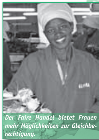
Der Faire Handel bietet Frauen mehr Möglichkeiten zur Gleichberechtigung.

vestiert“ als in Jungen. Sie erhalten weniger Schulbildung, müssen bei der Gesundheitsversorgung zurückstecken und verdienen später oft weniger. Kulturelles Selbstverständnis spielt da-